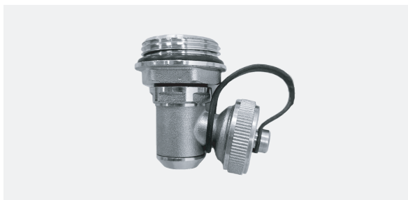
双功能末端泄水阀 (图片含补芯)